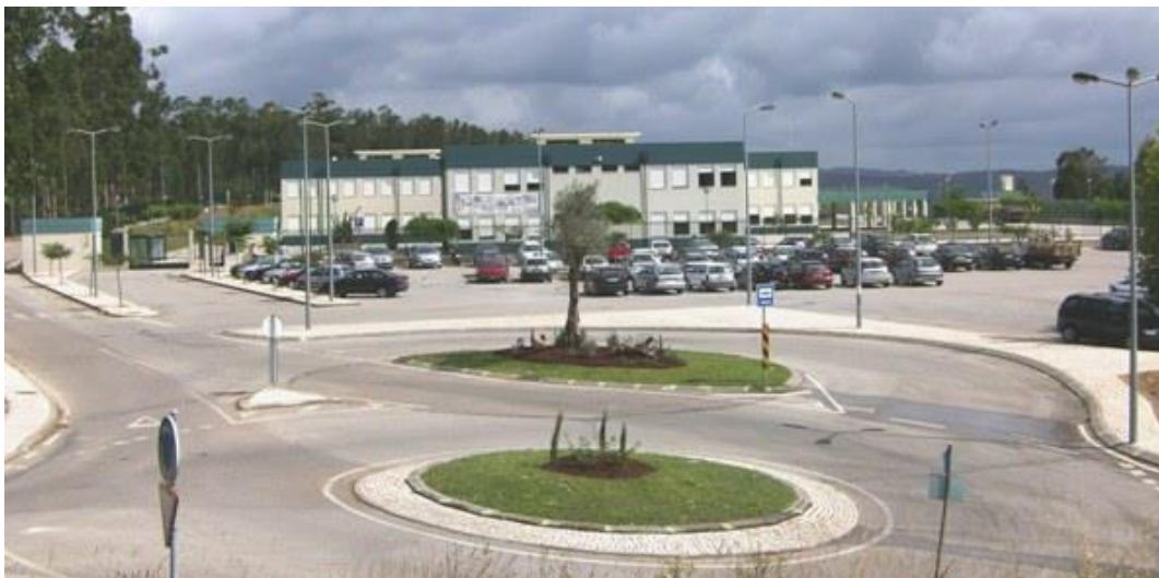
Escola Ferrer Correia - 2015